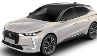
Sivá Cristal Pearl (M)