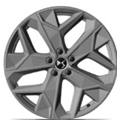
Zliatinové disky 19" SAPPORO (2HS9) v sérii pre PALLAS