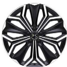
Zliatinové disky 19" SEVILLA (ZHT4) v sérii pre ÉTOILE ALCANTARA / NAPPA