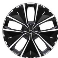
Zliatinové disky 20" SYDNEY (ZHT8) voliteľná výbava pre PLUG-IN HYBRID 225