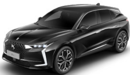
Čierna Perla Nera (M)