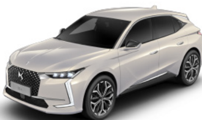
Sivá Cristal Pearl (M)