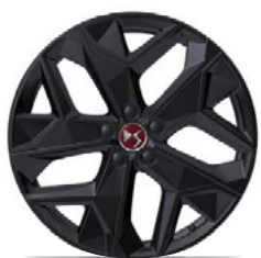
Zliatinové disky 19" MINNEAPOLIS (ZHT1) voliteľná výbava