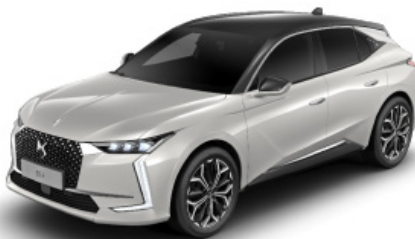
Biela Perleť (P)