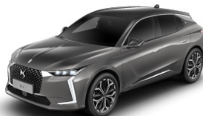
Sivá Platinium (M)