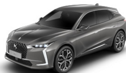
Sivá Platinium (M)