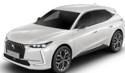
Biela Perleť (P)